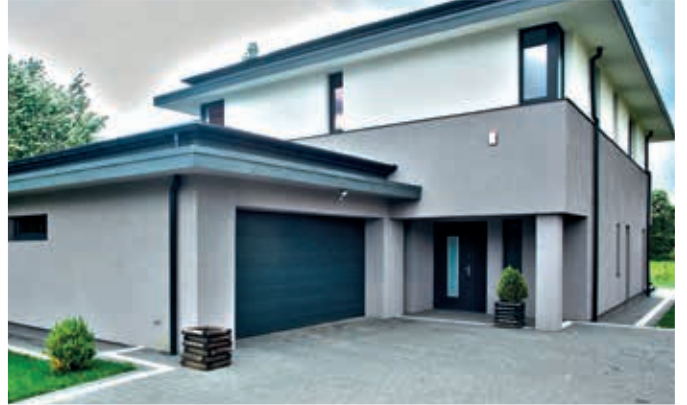
CASĂ ȘI GRĂDINĂ