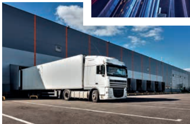
INDUSTRIE ȘI COMERȚ