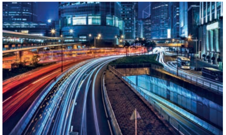
STRAZI ȘI CAI DE TRANSPORT