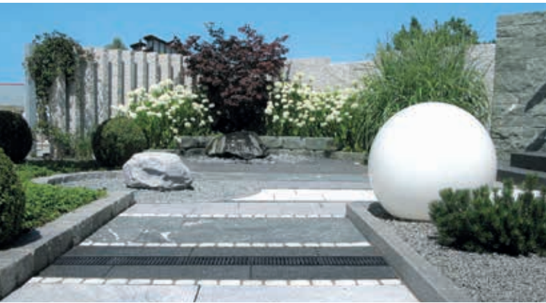
AMENAJĂRI PEISAGERE ȘI GRĂDINI