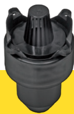
Ablaufanschluss mit Schmutzfang und Geruchsverschluss