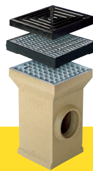
MEAGARD Hofablauf aus Polymerbeton (L x B x H: 300 x 300 x 450 mm)