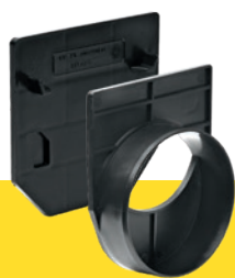
Stirnplatten mit und ohne Stützen

H1: 110 für MEAGARD II S/M/E Rinne, 115 für MEAGARD II G Rinne