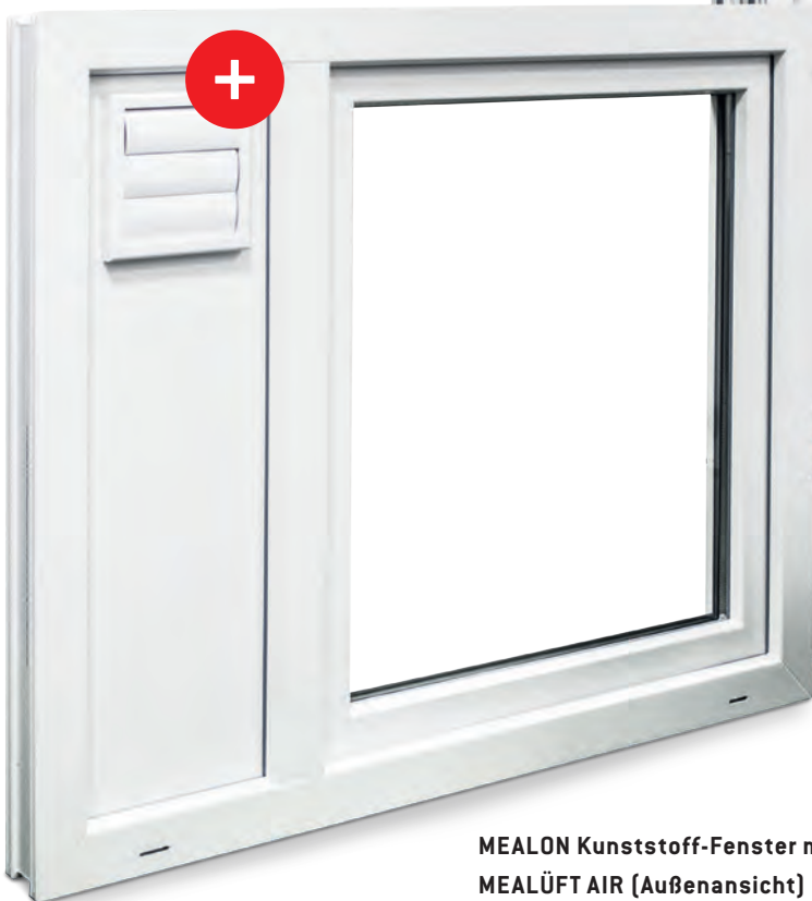
MEALUXIT Zargenfenster mit MEALÜFT AIR (Außenansicht)