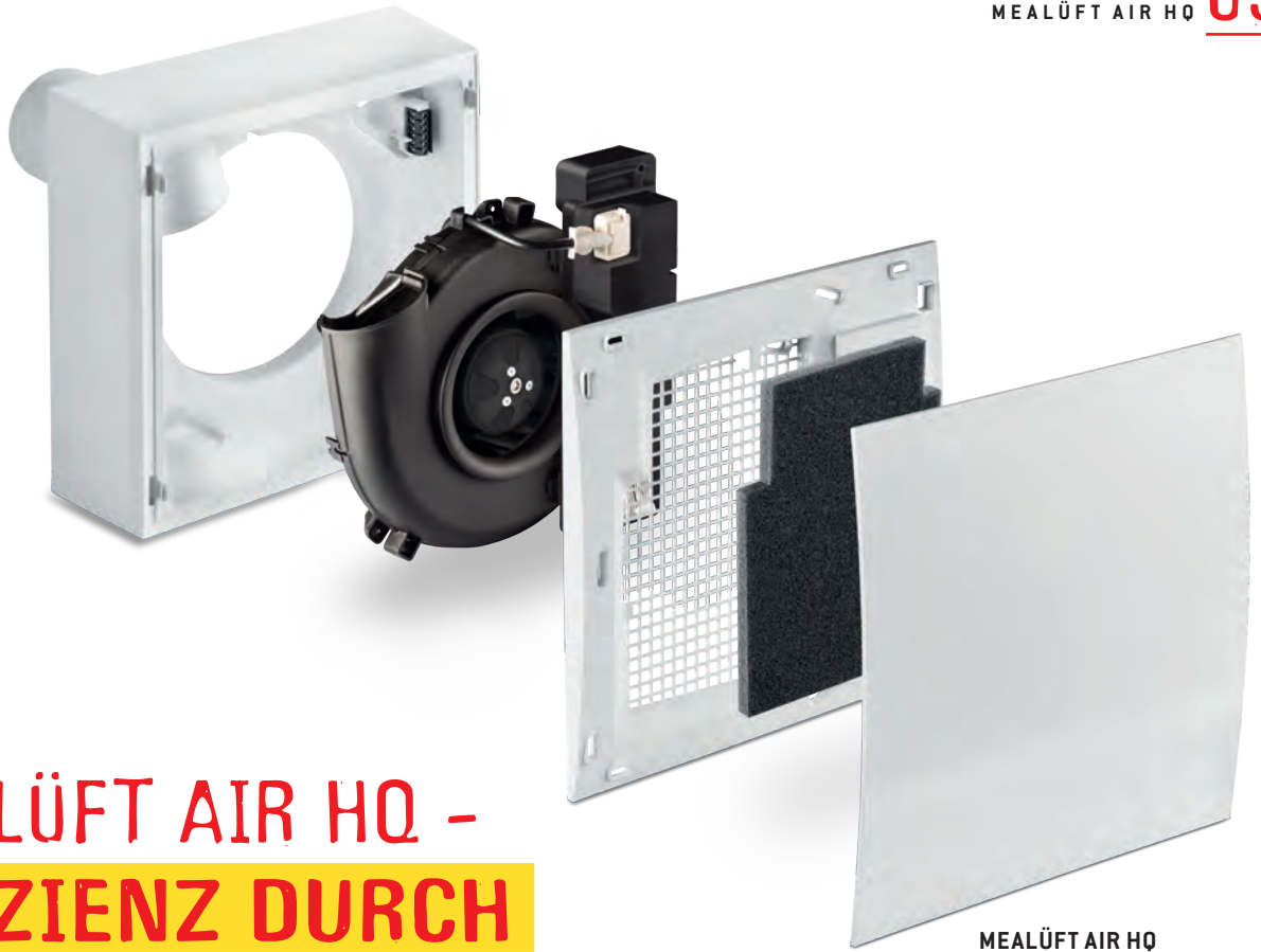
MEALÜFT AIR HQ