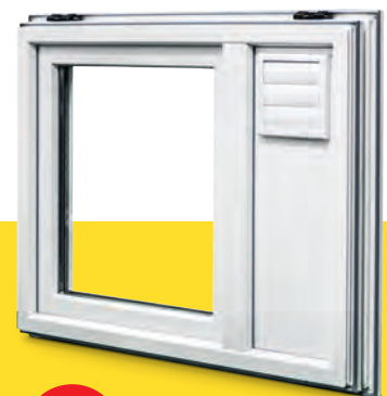
MEALON Kunststoff-Fenster mit MEALÜFT AIR Fenster