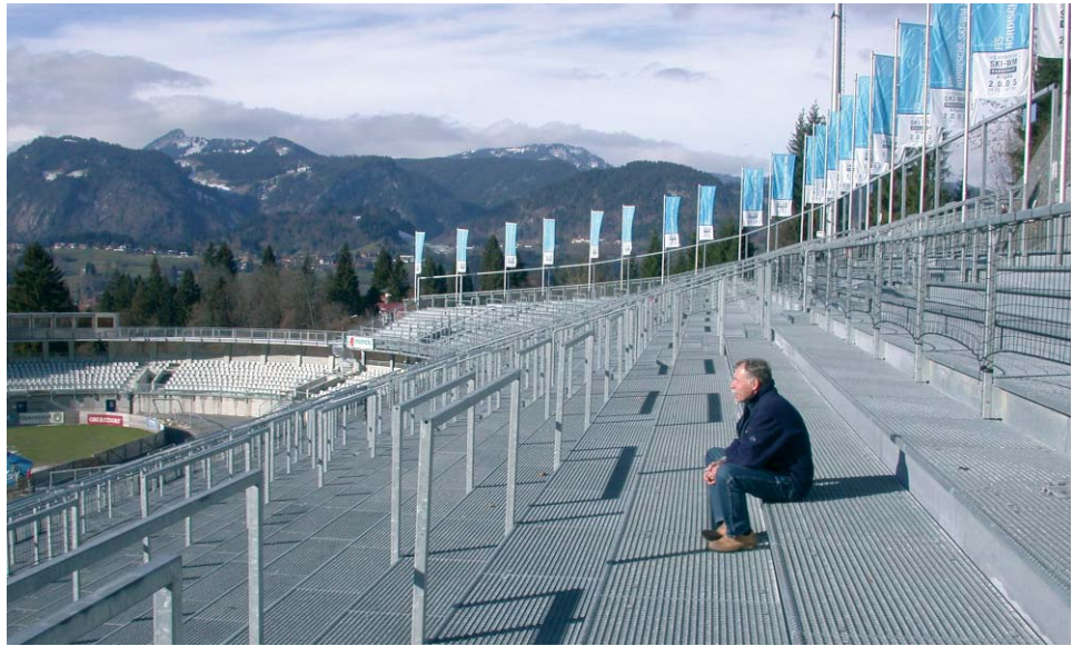
Optimal der Topografie angepasst: die neue Haupttribüne mit ihren feuerverzinkten Stahl-Gitterrosten

Plattform um 13 m in die Höhe. Die insgesamt 3.000 m 2 Standfläche ruhen auf einer Stahlkonstruktion. Für die Fundamente war in den Hanglagen der Einbau von Stahlbeton-Bohrpfählen mit einem Durchmesser von 600 mm notwendig, da der tragfähige Boden teilweise erst in 10 m Tiefe ansteht.